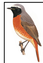
Rougequeue à front blanc